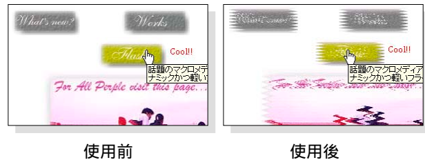
図 3. 我々の 1 人のページ

何を隠そう我々の 1 人のページこそそれである (図 3)。本システムを利用することで、怠惰なページ管理者に自分のページの悲惨な状況を視覚的に提示することができ、積極的な更新を促す効果が期待できる。