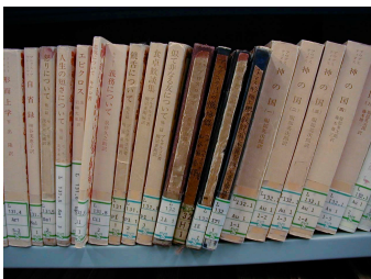
図 1 廃れた書籍

ここで問題となるのは、Web ページはどんなに古くなっても決して外見的に廃れることはないという点である。更新を全く行わなくてもページの見た目は変わらないため、どれほど情報の価値が低下していても一目でそれとはわからない。一方、現実世界に目を向けてみると、現実世界のモノは古くなると徐々に外見的に廃れていくのに気づく。例えば、古くなりあまり読まれなくなった書物は、傷ついたり変色したりして、すぐに情報の鮮度を見分けることができる (図 1)。